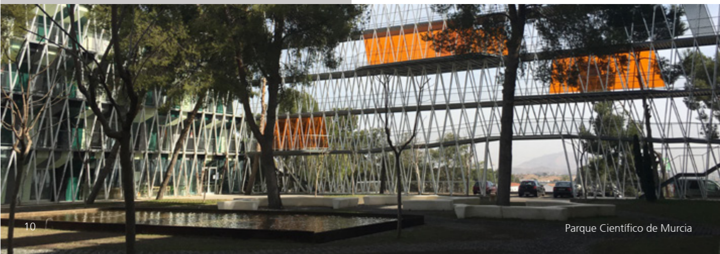
Parque Científico de Murcia